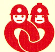
消防団協力事業所表示制度表示マーク

令和4年4月1日現在960事業所が県内市町の消防団協力事業所の認定を受けております。ぜひ、多くの事業所の皆様の参加をお待ちしています。