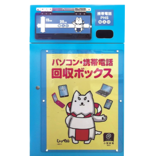
컴퓨터 휴대전화 회수 BOX

문의처: 쓰레기 대책과 Tel 0538-37-4812 Fax 0538-36-9797