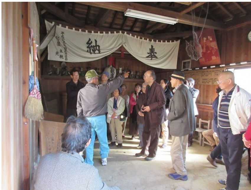
西浦観音堂で説明を受ける会員