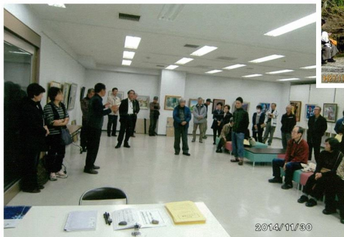
小品展のギャラリートーク