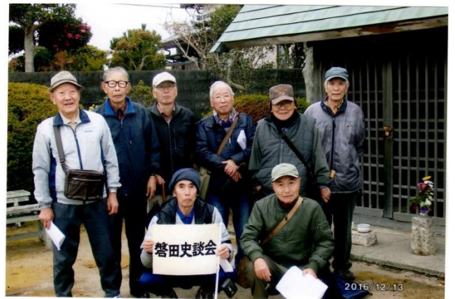
千手観音菩薩像（前野）