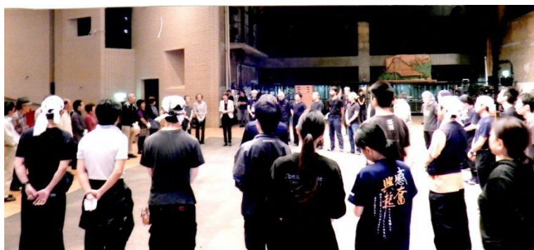
「今日は一日よろしく」 劇団と共に、例会成功させます。