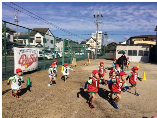
出前サッカー教室