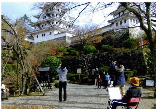
郡上八幡・磐美スケッチ会