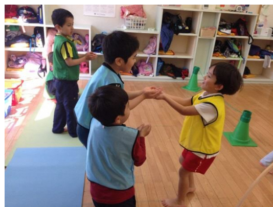
リーベ式運動遊び