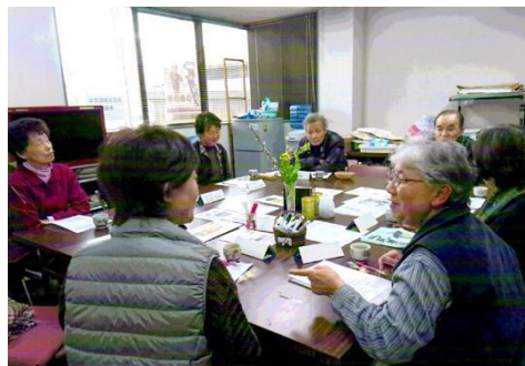
「たくさんの人に声かけしなくちゃあ」 会議