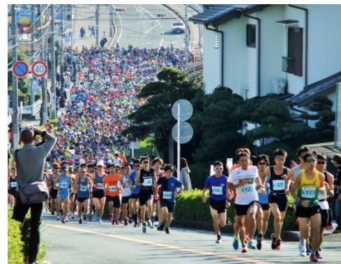
第 21 回ジュビロマラソン