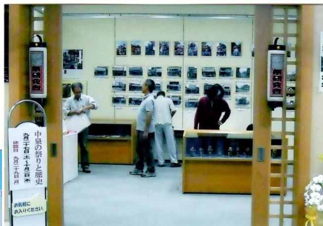
「中泉の祭りと歴史」展