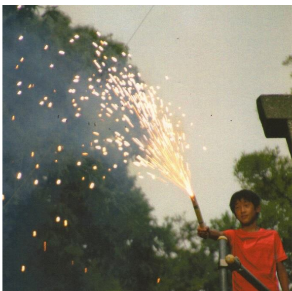
親子、子どもでも楽しめる「子供手筒」