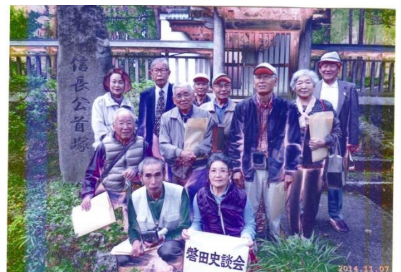
信長の首塚（富士宮市）