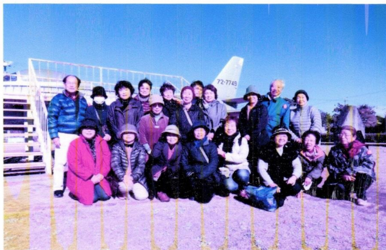
2016.12.10 明野飛行場跡で 熊野ふるさとプロジェクトロマンツアー