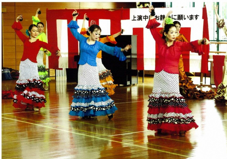
交流センターまつりの芸能発表