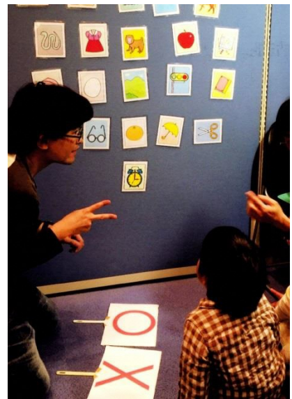
いわたふれあい広場 「手話体験コーナー」