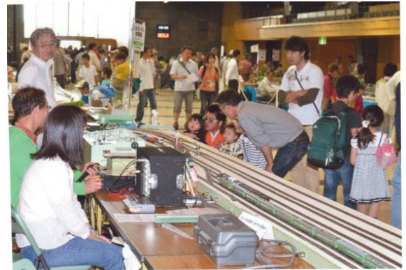
グランシップにて