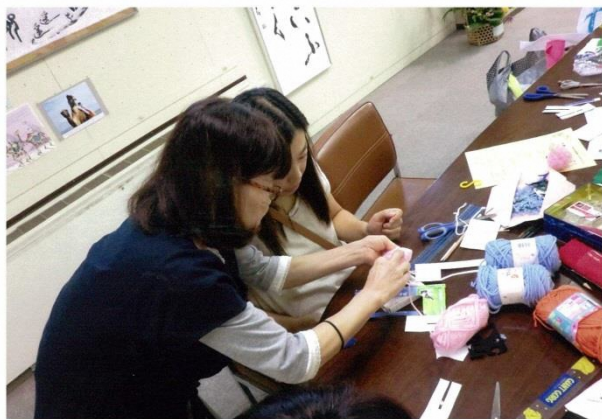
サロン活動の手芸