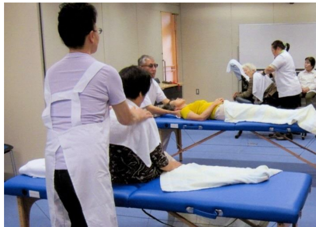
i プラザにて マッサージの無料奉仕