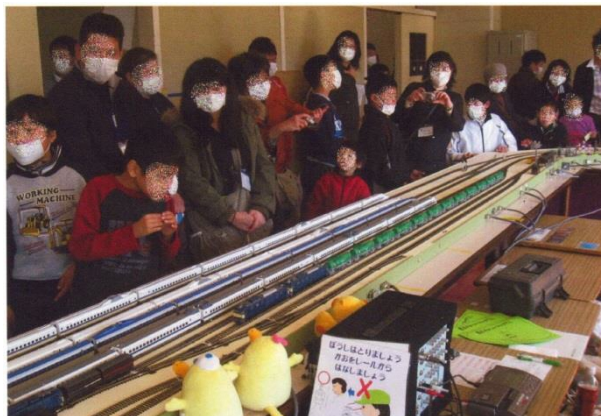
袋井特別支援学校にて