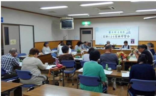
「家族による家族学習会」