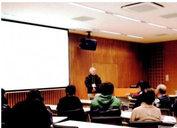
サークルの講習会