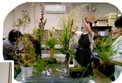
自然の木や花を生かした 生け花教室