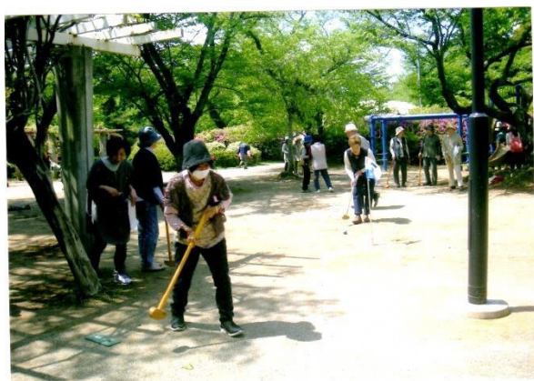
つつじ公園でグラウンドゴルフ