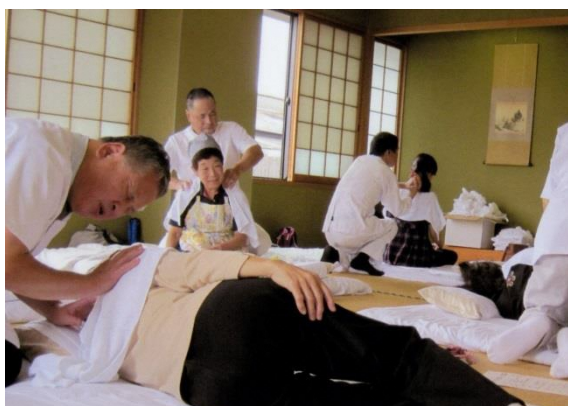
とよだふれあい広場にて