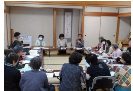
地域会（つばさの会）