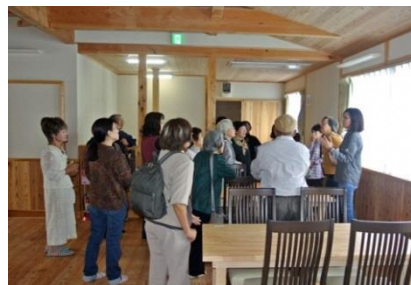
「秋のつどい」作業所視察