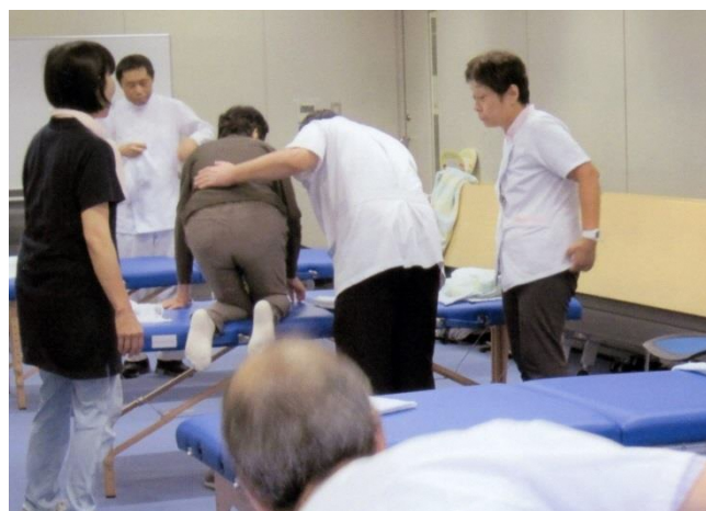
i プラザにて マッサージの無料奉仕