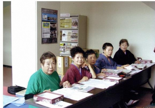
認知症講演会の受付