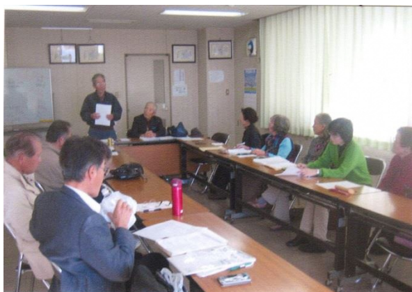
毎月開催の定例会