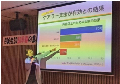
「早春のつどい」講演会