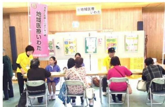
「ありがとうメッセージ」は、かかりつけ医さんに届けます