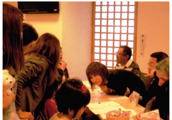
「手話体験コーナー」にて ろう者から教わる子ども達