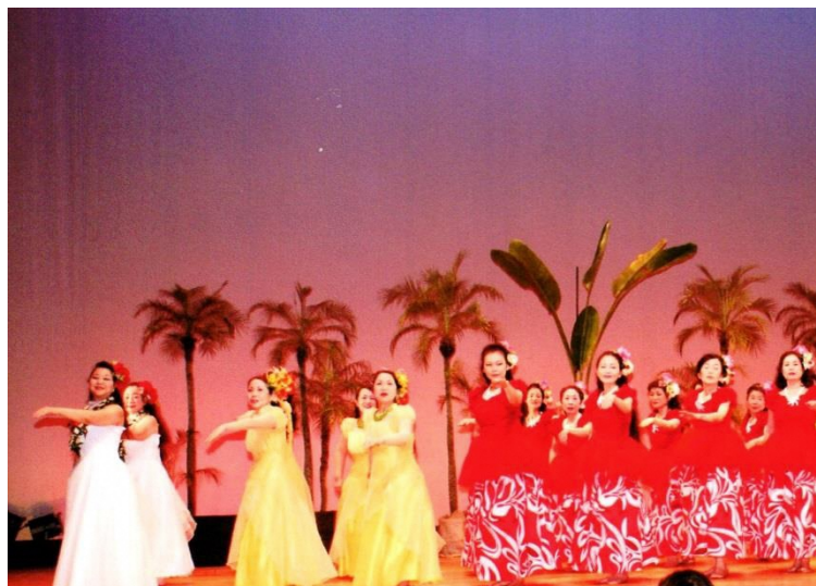
年1度の発表会 アミューズ豊田ゆやホール