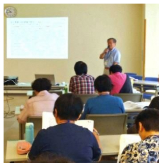
出前講話（磐田市社協）