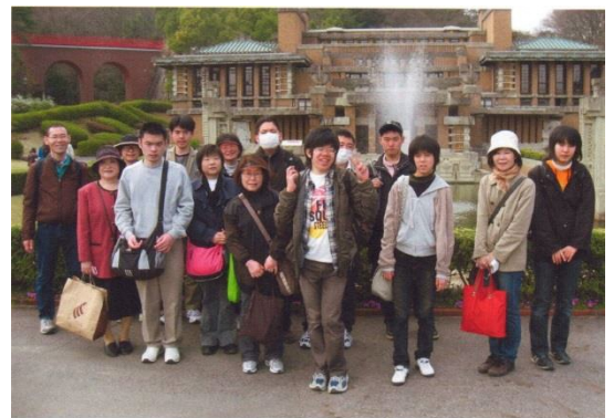
パンダツアー明治村にて