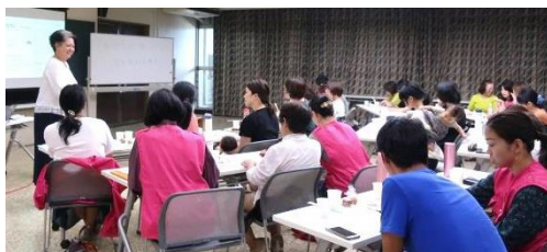
防災力UP講座 ～家庭内DIG～