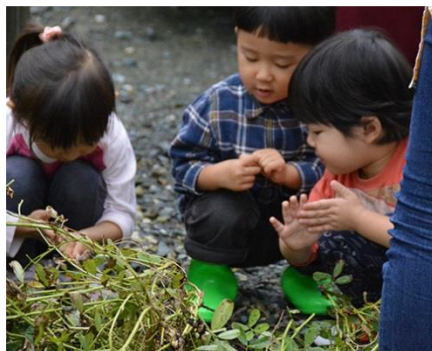
庭で落花生の収穫