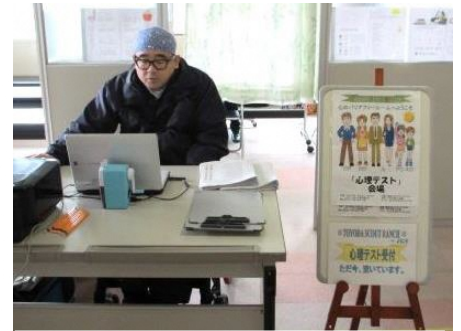
豊田ボランティア祭り 「心理テスト」コーナー