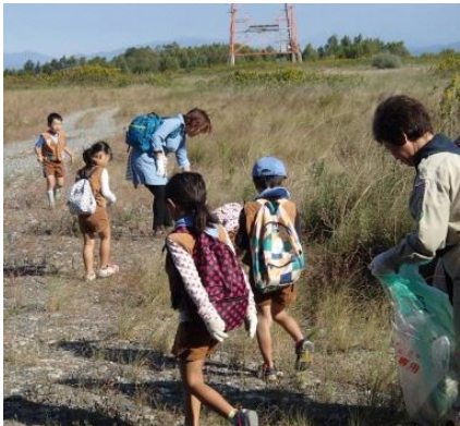
豊田ライオンズクラブ主催 「天竜川クリーン作戦」