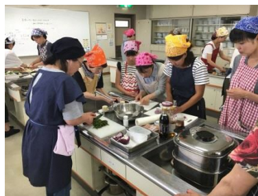
省エネ講座 ～薬膳料理～