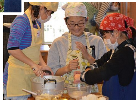
クッキング小学生コース (手作り豆腐)