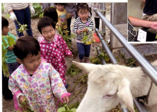
6月、10月収穫体験。動物にも触れ合いました