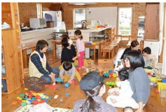
子育て支援センターの様子