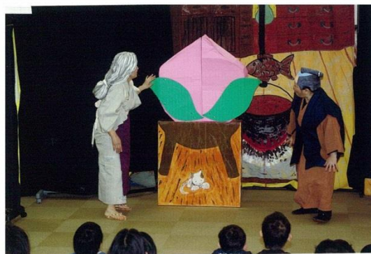
劇「ももたろう」 おじいさん おばあさん