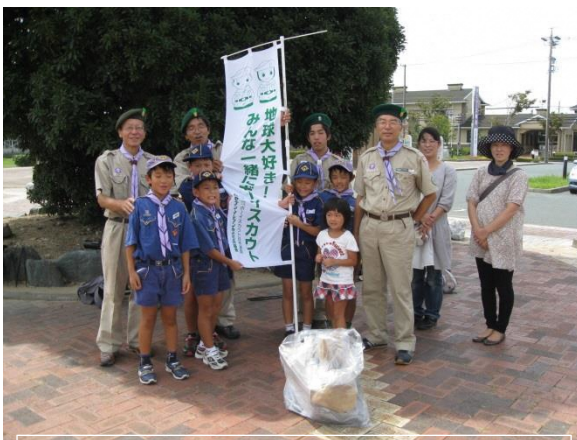
スカウトの日 町美化奉仕参加