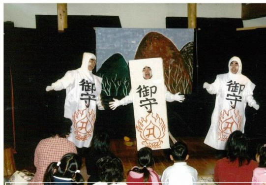
劇「3枚のおふだ」 お札たち