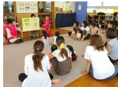
防災出前講座 防災絵本よみきかせ