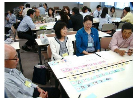
出前講座での ワークショップ