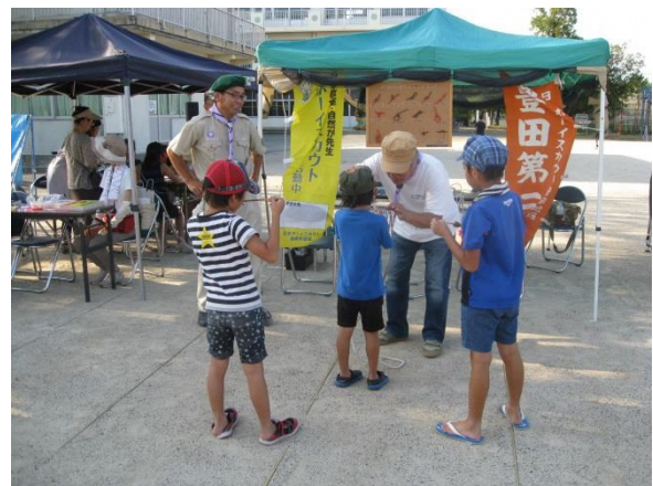
防災キャンプ ロープワーク支援