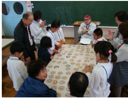
豊田東/豊田南小学校 「放課後子ども教室」