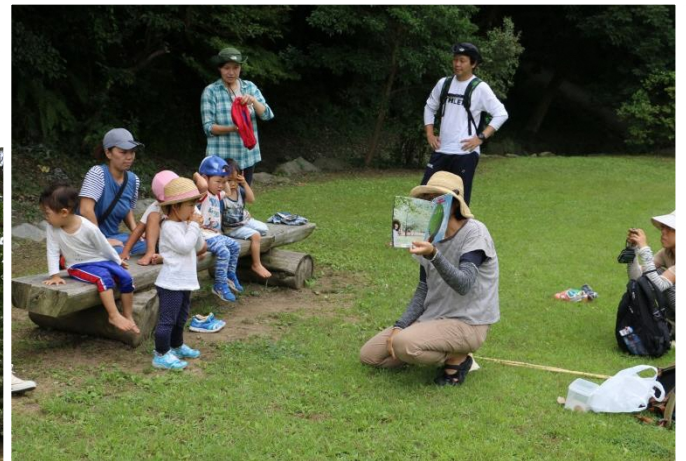
わくわく本読みの時間