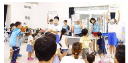
いわた親子防災フェスタ