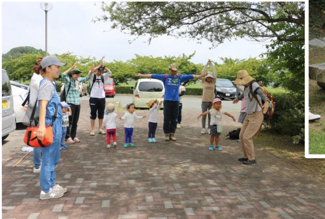
おさんぽ準備体操