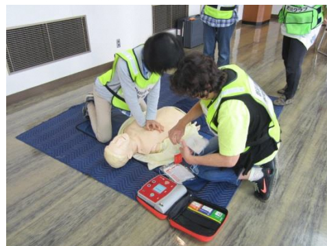
心肺蘇生法と AED 体験