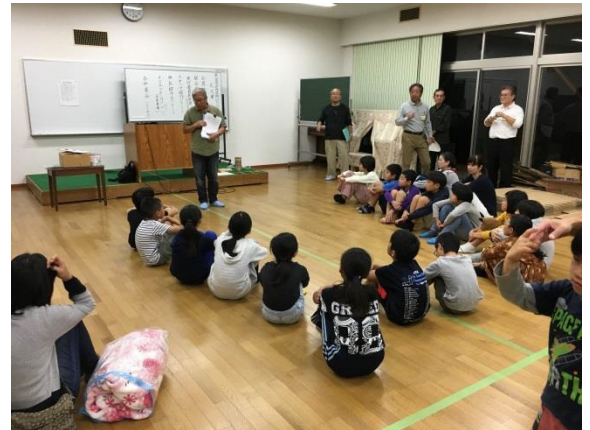
地域の防災宿泊体験会への協力