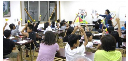
防災合宿での 非常食作り・防災クイズ