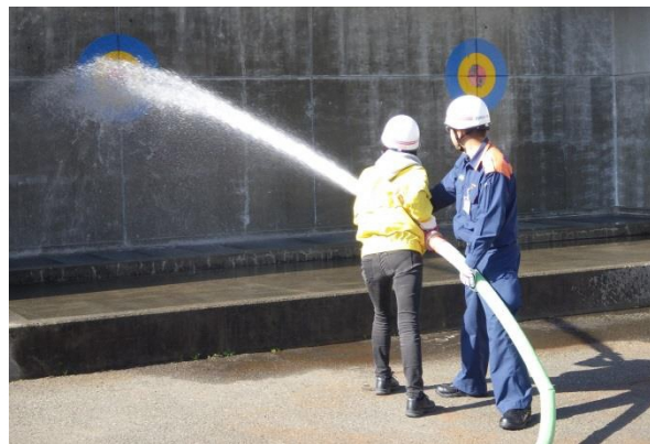
消防学校での消火訓練