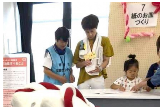
親子向け防災イベントへの協力