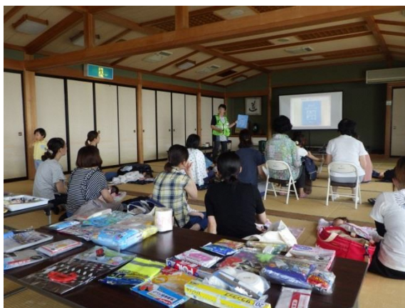
母親向け防災講座