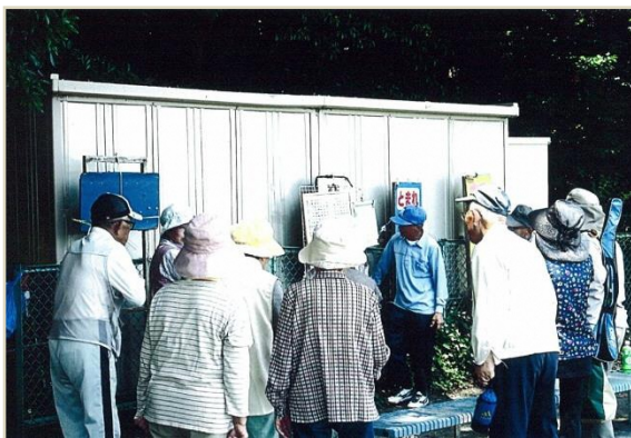
クラブ活動結果発表