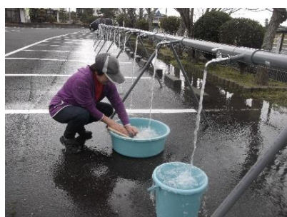
洗濯もできる連続給水栓装置 〈市水道と同等の圧力・給水量〉