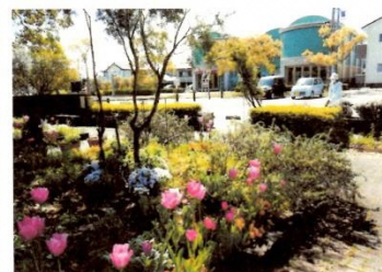
香りの公園ハーブ花壇の様子