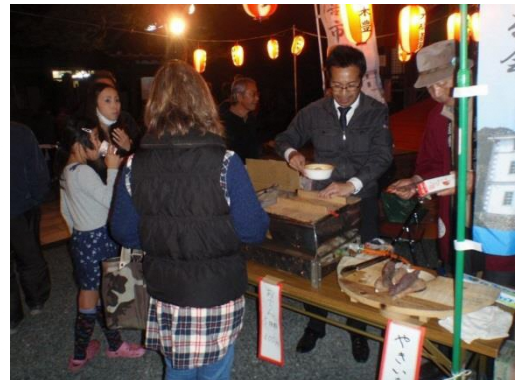
玄妙寺御命講での 「古都富喜市」の様子