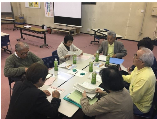
袋井市ボラ連との交流会