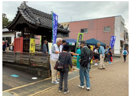
「見付宿たのしい文化展」 本部（いこい茶屋）前の様子