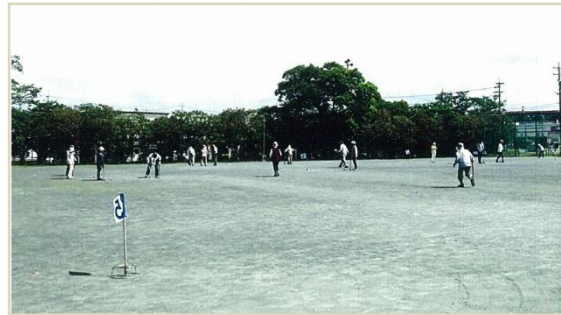
大空のもとプレー中風景