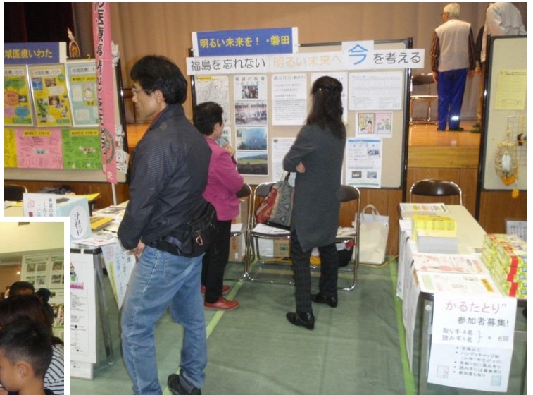
市民活動フェスタ 2016 於；ワークピア