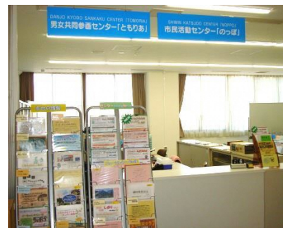
市民活動センター