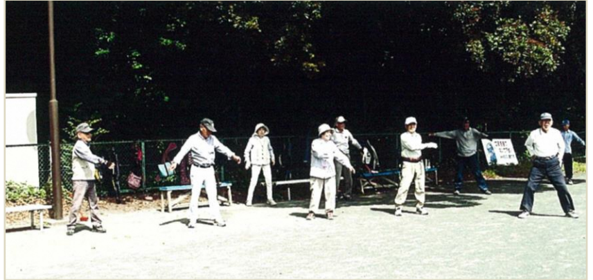
グラウンドゴルフ前準備体操