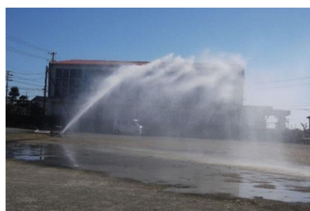
磐田鮫島方式の揚水状況 〈可搬式消防ポンプフル運転。 火事も消せます。〉