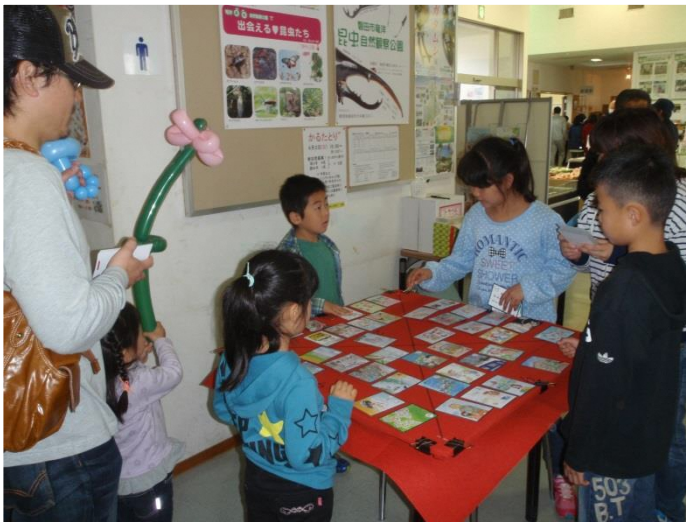
「原発ゼロかるた」とり 於；しおさい竜洋