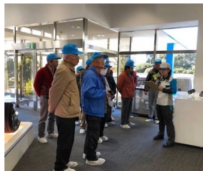
磐田のお宝見聞事業 工場見学