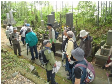
「見付ウォーク」 石塔めぐりの様子