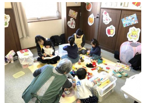
いわたっ子サポート事業 託児活動