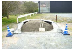
西庁舎北側に設置された土のうステーション▲

近年、ゲリラ豪雨といわれる短時間で局地的に降る大雨や、台風などによる浸水被害が発生しています。被害をできるだけ少なくするためには、行政の対応とともに、地域の皆さんにも自ら行動していただくことが重要になります。そこで市では大雨に備え、自分で土のうを作り、持ち帰っていただける場所「土のうステーション」を西庁舎北側と各支所に設置しています。