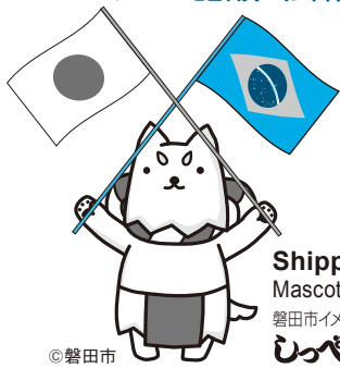
Shippei Mascote da cidade 磐田市イメージキャラクター しっぺい