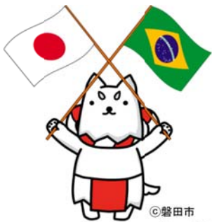
磐田市イメージキャラクター ひっぺい