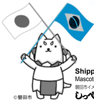
Shippei Mascote da cidade 磐田市イメージキャラクター うっぺい