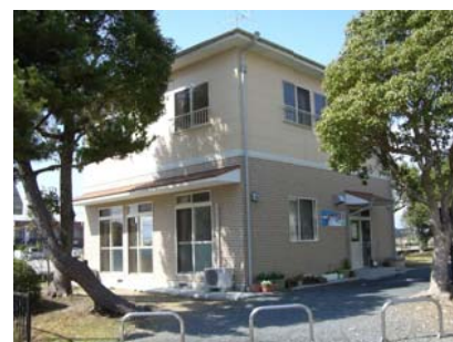
磐田市多文化交流センター「こんにちは！」

問い合わせ先 市民活動推進課 Tel: 0538-37-4710 / Fax: 0538-37-5034