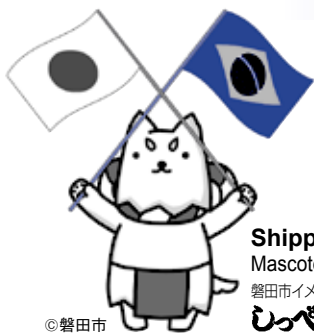
Shippei Mascote da cidade 磐田市イメージキャラクター しっぺい