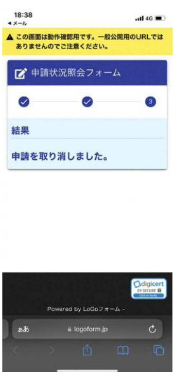
⑥「申請を取り消しました」 が表示されれば取消完了