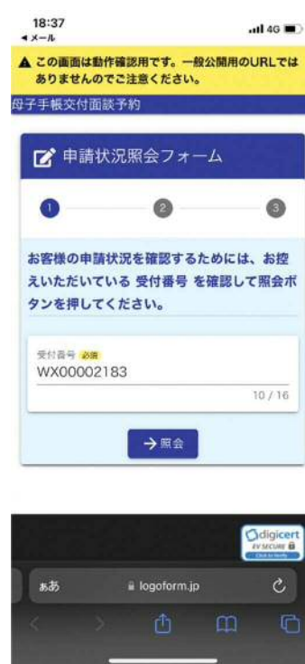
③「申請状況照会フォーム」 上の「→照会」を選択