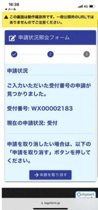
④「→申請を取り消す」 を選択