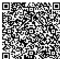
「障がい者のしおり」QR

障害の種類や程度、世帯の所得などにより、利用できる制度と利用できない制度があります。また、障害福祉サービスを利用するには、申請手続きが必要となりますので、「障がい者のしおり」をよくお読みください。