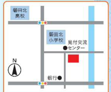
城山・向陽地域包括支援センター 見付2510-4 見付交流センター駐車場内