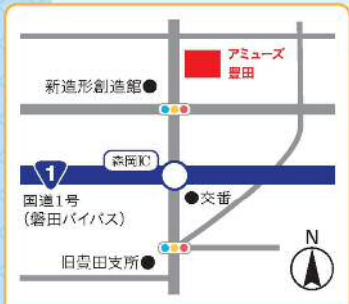
豊田地域包括支援センター 上新屋304 アミューズ豊田内