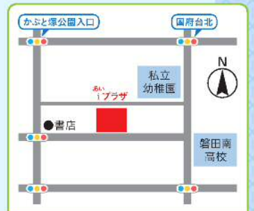
中部地域包括支援センター 国府台57-7 iプラザ1階