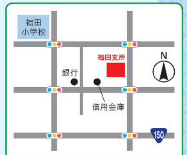
福田地域包括支援センター 福田400 福田支所1階