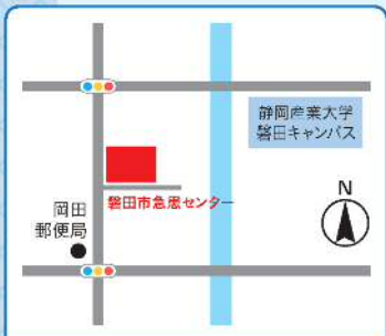
南部地域包括支援センター 上大之郷51 磐田市急患センター1階