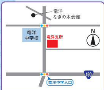
電洋地域包括支援センター 岡729-1 電洋支所1階