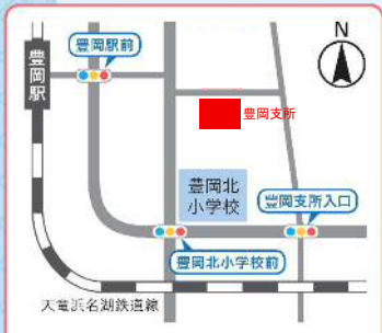
豊岡地域包括支援センター 下野部57-1 豊岡支所1階