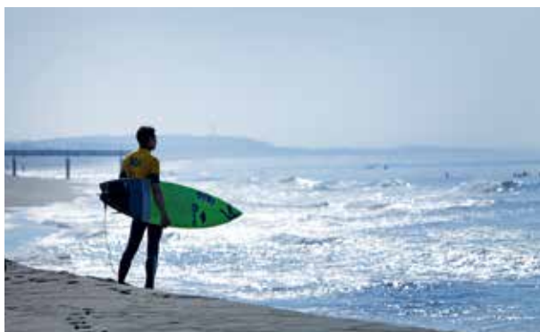
▲県内有数のサーフスポット豊浜海岸が決戦の舞台に