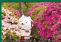
▶カラオケ配信動画にはハツツジや大クス、ベッコウトンボが出てきます

市歌をカラオケ配信しています。バック動画は市内各所を撮影したプロモーションビデオです。全国のカラオケ店（JOYSOUND MAX）「JOYSOUND」設置店で、お店のキョクナビ（リモコン）の歌手名（磐田市）・曲名（磐田市歌ふるさと いわた）から楽曲を検索、またはキョクナビトップの「いろいろ検索」→「うたスキミュージックポスト」の順に進み、楽曲検索し、選曲します。