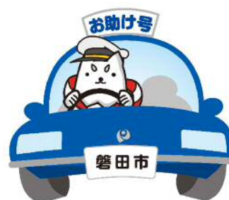
デマンド型乗合タクシー お助け号