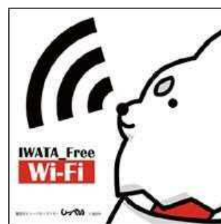
公衆無線 LAN IWATA Free Wi-Fi