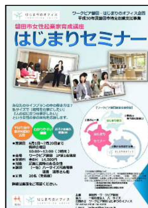
はじまりセミナー