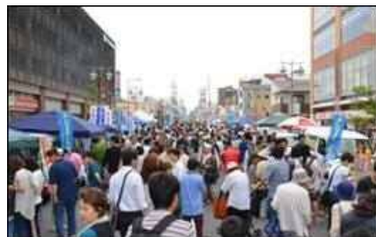
みんなで軽トラ市 いわた☆駅前楽市