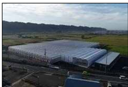
太陽光利用型植物工場

※【農地銀行制度】 貸付け(売却)を希望する農地の情報を登録し、借りたい農業者が閲覧することで、農地の出し手と受け手をマッチングさせる制度。