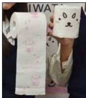
しっぺいトイレトペーパー