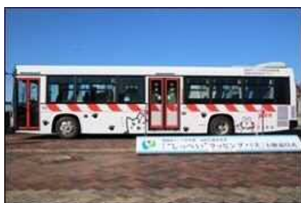
しっぺいらッピングバス