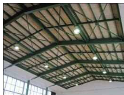
交流センター体育館照明のLED化