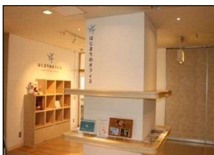
コワーキングスペース