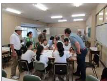
交流センター HUG 訓練