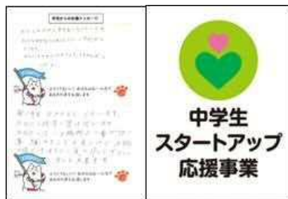
中学生スタートアップ応援事業 (応援メッセージ)