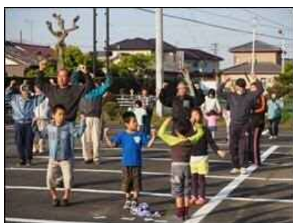
交流センター みんなでラジオ体操