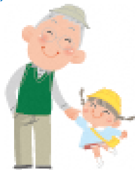
ライフステージに応じた支援体系図

磐田市発達支援センター「はあと」での相談事業、 子ども若者家庭センターでの子ども相談事業、 指定障害児相談支援（障害児相談支援給付）