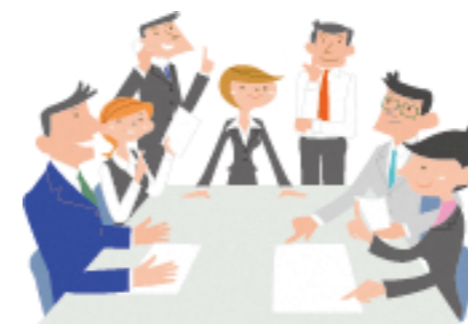
基幹相談支援センターのイメージ

障がいのある人の重度化・高齢化や「親亡き後」を見据えた、相談、一人暮らしの体験機会及び緊急時の対応など、地域生活支援の提供の調整を基幹相談支援センターの機能とし、地域生活支援拠点等の体制を構築します。