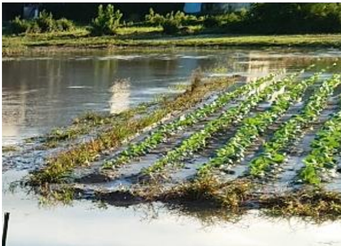
キャベツほ場の冠水被害 (磐田市野部)