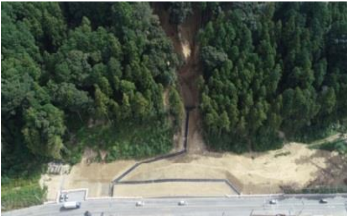
↑神増（現状応急工事後）