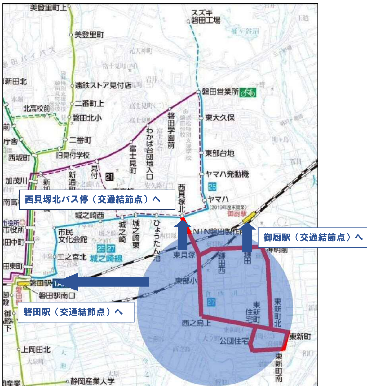
デマンド型乗合タクシー 磐田東部線 運行区域

掛塚さなる台線（横須賀系統）は、横須賀高校通学利用者への影響が大きい実態を鑑み、2018年度から関係者等へ周知を行い、当初2019年10月での退出予定を延期して2021年3月末まで運行を継続します。尚、現在のバス通学者は入学前から当該退出を認識されています。