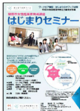
はじまりセミナー