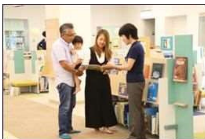
ひと・ほんの庭 にこっと

■平成 27 年度以降、待機児童は0人を継続していたが、3年振りに待機児童が発生している。依然として保育需要は高く、さらなる保育枠の確保に努める必要がある。