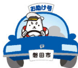
デマンド型乗合タクシー お助け号