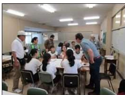
交流センター HUG 訓練