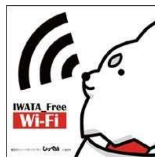
公衆無線 LAN IWATA Free Wi-Fi