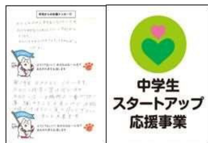
中学生スタートアップ応援事業 (応援メッセージ)