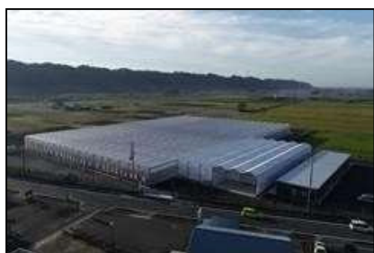
太陽光利用型植物工場

※【農地銀行制度】貸付け(売却)を希望する農地の情報を登録し、借りたい農業者が閲覧することで、農地の出し手と受け手をマッチングさせる制度。