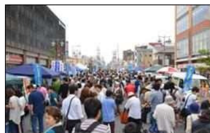
みんなで軽トラ市 いわた☆駅前楽市