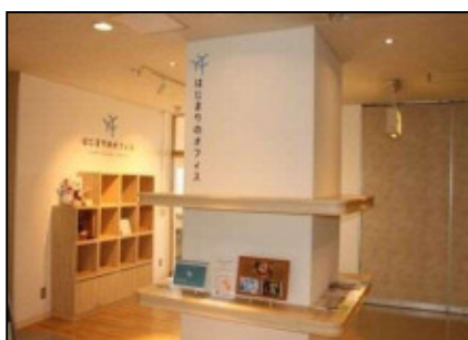
コワーキングスペース