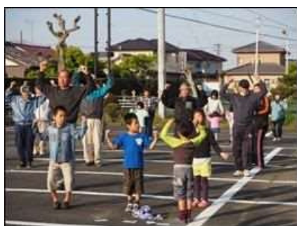
交流センター みんなでラジオ体操