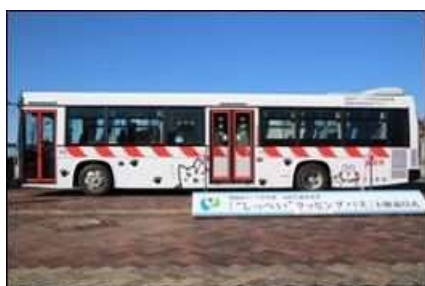
しっぺいらッピングバス