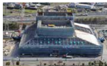
(仮称)磐田市文化会館建設の様子(3年3月現在)

【歳出8款 総務費】 問 パブリックコメントを行った際に、一旦、基本方針を出した経緯もあるため、これまでの意見を踏まえて内部で構想・方針を作成できればよいと考えている。3年度中に必ずできるという用途は立っていない。