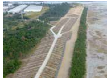
海岸防潮堤整備の様子

答 安全安心を実感できる防災対策が重要と考え、防潮堤や防災センターの整備を進めてきた。ソフト事業では災害に強い地域づくり条例の制定、市町村広域災害ネットワークへの加入等に取り組んだ。