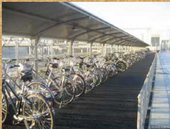
御厨駅北自転車駐輪場

市議会では、御厨駅周辺整備が円滑に進み、御厨駅やこの地域がますます皆様から愛され親しまれながら発展していくよう市執行部に求めてまいります。