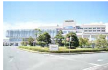
磐田市立総合病院

答 陽性患者の受入れ人数は3月1日時点で累計104人である。課題は対応する職員の確保で、求める人材の応募が少ないことである。高齢者の入院する比率が高く期間も長くなる傾向にあり、病状により配置する職員数も変わる。引き続き院内人材の教育を進め、機を捉えた採用活動を継続し、過度な負担とならない適切な人員配置に努める。