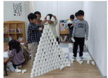
放課後児童クラブ