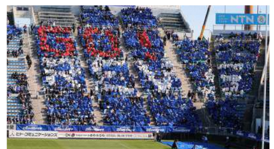
静岡ブルーレヴズホームゲーム中学生一斉観戦