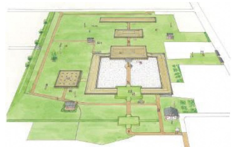
国分寺再整備イメージ図