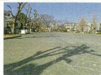
上野公園の地下調整池整備予定地

川の氾濫を防ぐため、久保川へ流れる雨水の量を調整するために、上野公園の地下に雨水をためる調整池整備を計画している。公園のグラウンドの地下に貯留槽をつくり、地上はグラウンドとして利用できる。5年の間に事業を着手していきたいとの説明であった。