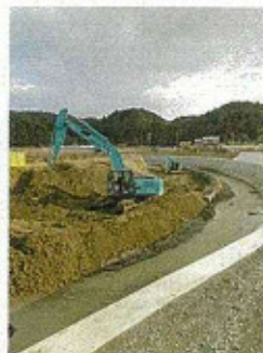
堤防復旧工事が進む敷地川 (令和7年1月7日)