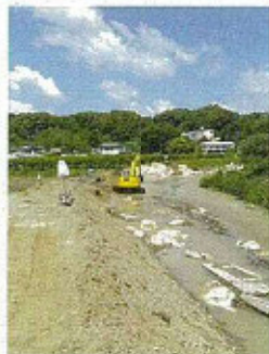
仮復旧中に決壊した敷地川堤防 (令和5年6月5日)

敷地川は、令和4年9月の台風第15号に続き、令和5年6月の台風第2号により被害を受けた。敷地川の堤防改良復旧工事の進捗状況を袋井土木事務所職員から説明を受けた。復旧に加えて川幅を広げるなどの改良も行う事業となっている。右岸側は、令和6年7月上旬に完成し、左岸側は令和7年12月末の完成を目標に工事を進めている。