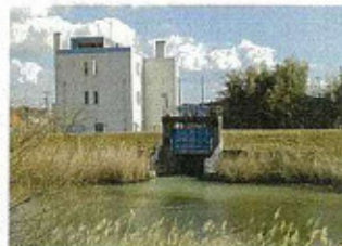
今ノ浦川第1ポンプ場と南側建設予定地

老朽化している今ノ浦川第1ポンプ場の建替予定箇所の説明を市職員から受けた。現在は、毎秒約3トンの排水ポンプが2基設置されているポンプ場である。これを1基増やし3基にして毎秒約9トンの排水能力に高める計画である。場所は、現在のポンプ場南側を予定している。