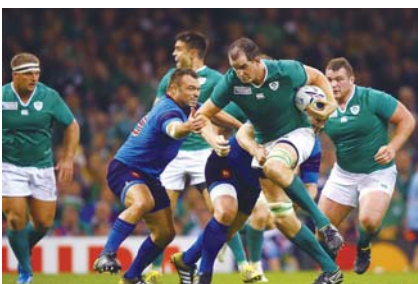
▲アイルランド代表

磐田市・掛川市へは、アイルランド、ルーマニア、オーストラリアの3カ国が滞在します。この3チームは2019年9月28日(土)、10月9日(水)・11日(金)にエコパスタジアムで試合を行うチームです。大会はまだ少し先ですが、今から楽しみです！