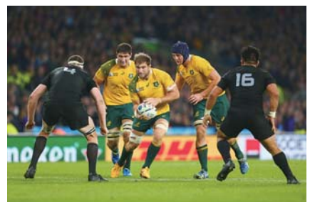
▲オーストラリア代表