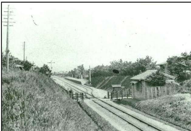
明治 22 年ごろの中泉停車場(西から)

鉄道は、明治という新しい時代の近代化の象徴であり、文明開化を地方へ伝播させる有効な手段という面を有していました。磐田の人々は、速く、大量に、そして安全に人や物を運ぶ鉄道の姿を目の前にし、鉄道建設をとおした地域の発展への夢や願いをもち、よりよい郷土づくりを目指して進めていきました。