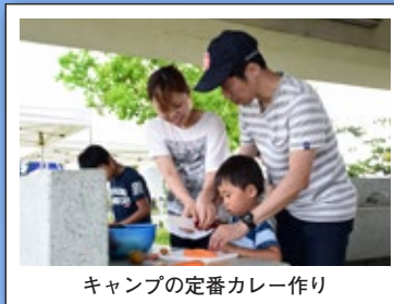
キャンプの定番カレー作り