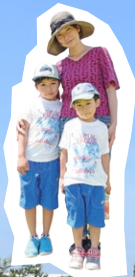
南さんとお子さん