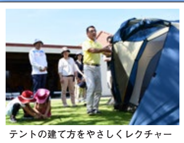
テントの建て方をやさしくレクチャー

初心者の方を対象に、4月と6月にキャンプ体験が行われました。参加者はテントやタープの設営方法など、キャンプに必要な知識を楽しみながら習得しました。