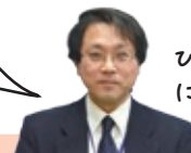
ひと・ほんの庭 にこっと館長