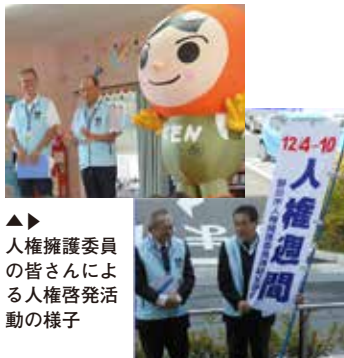
▲▶ 人権擁護委員の皆さんによる人権啓発活動の様子