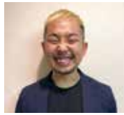
三十祭実行委員会 委員長