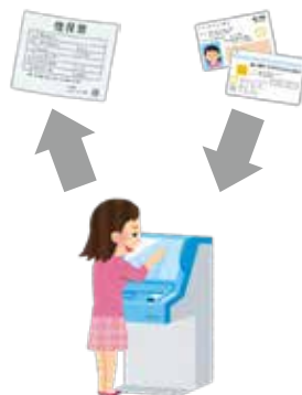
▲交付手順（イメージ）