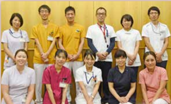
▲平成28年度から市立総合病院とすずかけヘルスケアホスピタルの看護師、管理栄養士、理学療法士、歯科衛生士、言語聴覚士などの専門職と一緒に作り上げてきたプログラムです

誤嚥性肺炎減らそう隊の講座は、誤嚥性肺炎の予防だけでなく、認知症や寝たきりの予防にもつながります。講座はわかりやすいお話と動画を観ながら運動を行います。