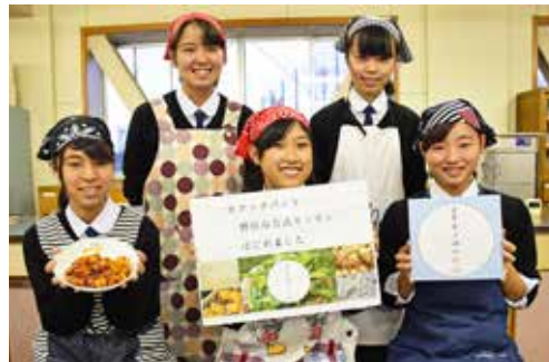
公式キッチンの初回レシピの考案やロゴの制作に、磐田西高校家庭部の皆さんにご協力いただきました。ぜひレシピをご覧ください。