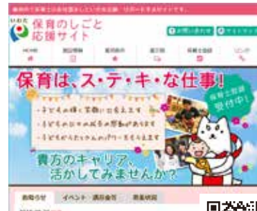
▶▶ いわた保育のしごと応援サイト

市では、保育士・幼稚園教諭などを募集しています。プランクのある方でも安心して勤務できるような、職場見学や体験も実施しています。来年4月から勤務希望の方や、まずは登録だけしたいという方もお気軽にお問い合わせください。 ▼資格/保育士、幼稚園教諭、調理師は資格が必要 ▼待遇/交通費支給、有給休暇あり、各種保険完備 ▼勤務地/市内公立園 ※勤務地・勤務時間は応相談