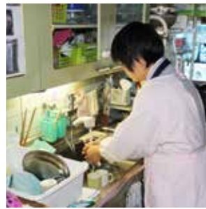
▲訪問介護員による生活援助

など自分に合ったもので構いませんが、それが地域で必要とされる活動であれば、一層やりがいがあると思います。皆さんもぜひ「生活支援の担い手としての社会参加」をしてみませんか。