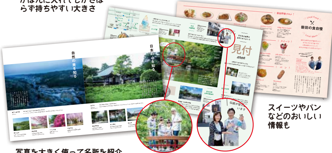
写真を大きく使って名所を紹介