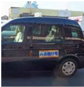
▲「お助け号」のマークの車両がお迎えに行きます

平成30年10月末現在、約7000人が登録し、一カ月あたり約1900人が利用しています。特にバス停までの移動が難しい高齢の利用者から好評です。