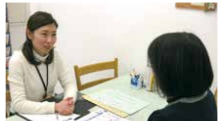
▲相談の様子(イメージ)

◎センター開所時間:月～金曜日 午前8時30分～午後5時15分(祝日、休日、年末年始(12月29日～1月3日)を除く)