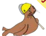
協力雇用主のアシカ親方

問 福祉課（いプラザ3階） ☎ 0538-363714814 FAX 0538-36371635