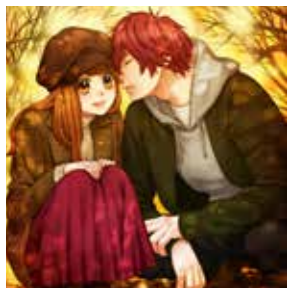
「矢神くんは、今日もイジワル。」 集英社

▶とき／3月3日(日)①午前10時15分～②11時15分～(各30分程度)③午後1時30分～(約2時間) ▶ところ／ひと・ほんの庭 にこっと(上新屋304) ①②1階こどもシアター③2階視聴覚室 ▶対象／①赤ちゃんと楽しむわらべうたあそび(4カ月～8カ月)②小さい子の楽しむわらべうたあそび(9カ月～2歳)③わらべうたを学びたい大人 ▶内容／①②親子でわらべうたで遊ぶ③わらべうたを実際にやりながら覚える ▶定員／①②先着各15組③先着30人 ▶参加費／無料 ▶申込／2月22日(金)午前9時30分から直接または電話でひと・ほんの庭 にこっとへ