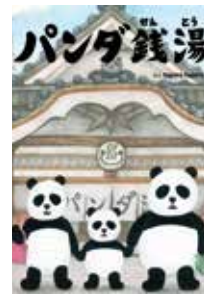
「パンダ銭湯」 絵本館