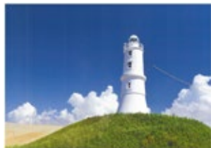
「掛塚灯台」 牧野 光伸