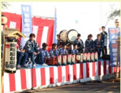
▲恒例となった掛塚祭屋台囃子の披露

毎年開催を楽しみにしていた皆さんにはご迷惑をお掛けしますが、ご理解をお願いします。