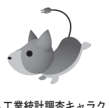
▲工業統計調査キャラクター「コウギくん」

工業統計調査は我が国の工業の実態を明らかにすることを目的とした統計法に基づく重要な統計調査です。5月中旬から統計調査員が訪問、または調査票が国から直接郵送されますので、調査にご協力をお願いします。 ☎総務課☎37-4803 FAX37-4829