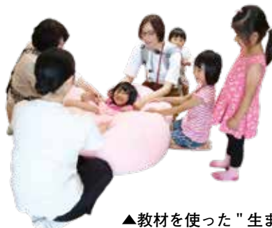
▲教材を使った"生まれる"体験

にこっとの講座・イベント情報は、磐田市メール配信サービス「いわたホットライン」で発信しています。登録方法など詳しくは市ホームページをご覧ください。