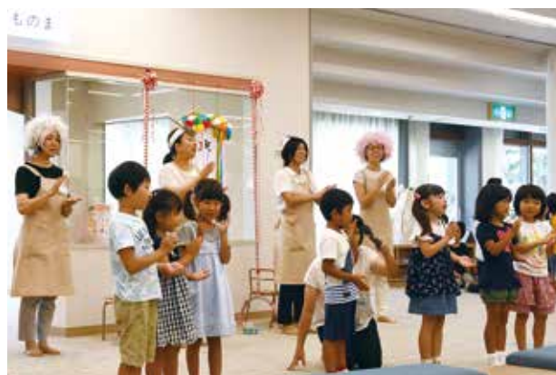
▲みんなで「にこっと」と「あんこ&きなこ」をお祝いしました

「ひと・ほんの庭 にこっと」がオープン1周年を迎え、ヤギのあんこ&きなこの1歳の誕生日祝いを兼ねておめでとうの会が開かれました。豊田南こども園の園児によるくす玉割りはじめ、歌や手遊び、ダンスの披露でお祝いしました。