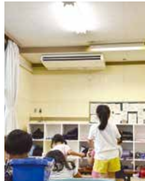
▲エアコンが設置された教室（イメージ）