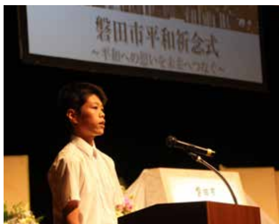
◀ 8月15日（日）に市民文化会館で行われた磐田市平和祈念式

自分の言葉や行動に責任を持ち、相手の気持ちになって違いを理解しようと努力して、自分の周りを平和にすることは、少し意識すれば誰でもすぐにできます。小さくさいなことです、その意思をより多くの人々が続けられれば、平和な世界へと近づいていくのではないかと思います。（スピーチから抜粋）