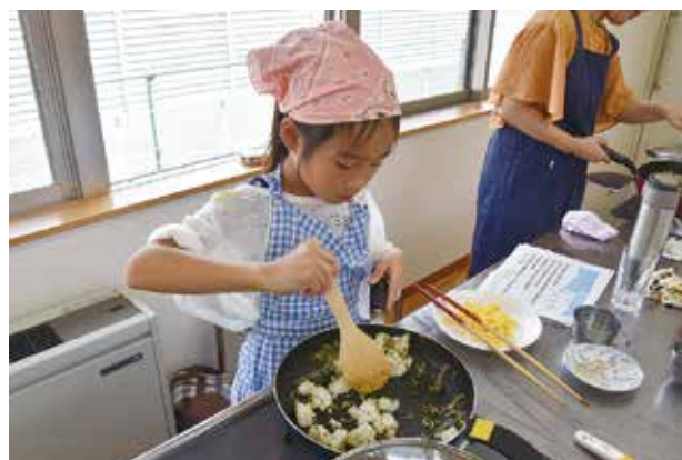
▲茶殻を使った「茶ーハン」。炒めたお茶の葉が良い香り！

池田交流センターで食品ロスゼロ・クッキング教室が行われ、4組10人の親子が参加しました。参加者は食材を「買いすぎず、使いきる、食べきる」ためのポイントを勉強した後、ニンジンの皮やキャベツの芯なども使って調理しました。