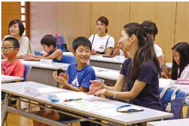
▲楽しみながら手話を勉強しました

いプラザで夏休み親子手話教室が開催され、市内小学4～6年生とその保護者10組が参加しました。