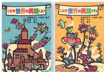
内田莉紗子[ほか] / 著 実業之日本社