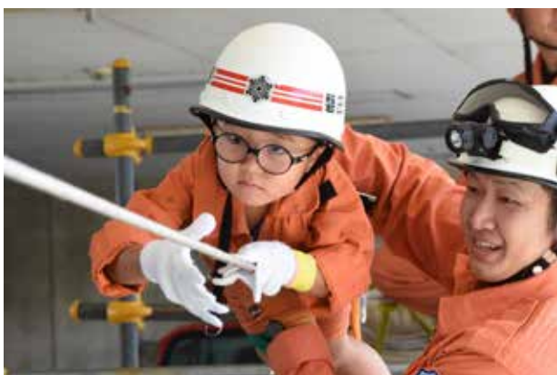
▲ロープ渡りに挑戦。気分はすっかり消防士さん

磐田市消防署では、消防の仕事や防火意識について楽しみながら理解を深めてもらおうと、親子消防体験教室を開催し、24組77人の親子が参加しました。子どもたちは複数のグループに分かれて、放水やロープ渡りなどさまざまな体験を行いました。