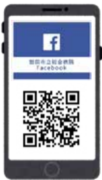
▲フェイスブックはこちらから

正面玄関にはフェイスブックで取り上げた内容の一部をポスター掲示し、来院された方々にも楽しんでもらえるよう取り組んでいます。