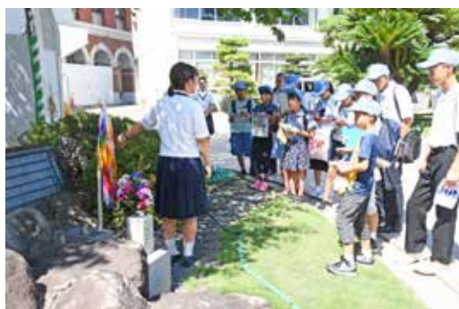
▲慰霊碑についての説明を受ける子どもたち

8月5日(月)、広島に着いた子どもたちは、被爆桜の苗木を譲り受けた安田女子高校(広島市中区)を訪問しました。そこで平和活動の中心となっている生徒会の方から、慰霊碑や被爆桜の前で「戦争」や「平和」、「被爆桜」に対する思いを聞き、過去を風化させないように伝えることの大切さを学びました。