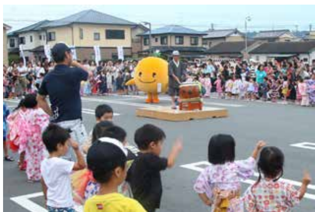
▲「ちびっ子盆踊り」では園児が練習の成果を披露しました

豊岡中央交流センターで「とよおか夏まつり2019」が開催されました。これまで個別に開催していた「ふれあい夏まつり」、「とよおか軽トラ市」、「豊岡中央交流センターまつり」を統合して開催。作品展示や軽トラ夜店、和太鼓やダンスなどのステージ、園児らによる盆踊りなど盛りだくさんの内容となりました。会場には多くの家族連れが訪れ、豊岡地区の夏まつりを楽しんでいました。