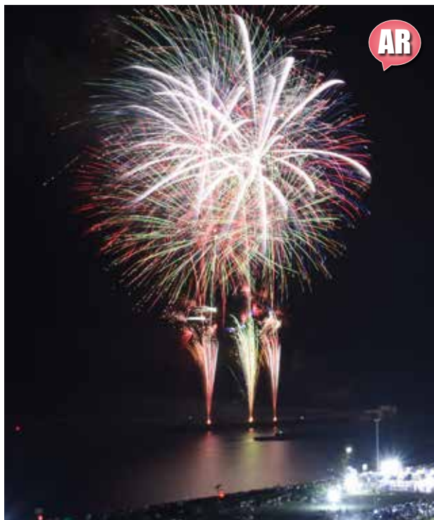
▲福田漁港の夜空と海面を彩る美しい花火

「海鳴りとの共演花火」をテーマに、遠州地方の夏を締めくくる「2019いわた夏まつり花火大会」が今年も開催され、夜空を彩る大輪の花が多くの観客を魅了しました。