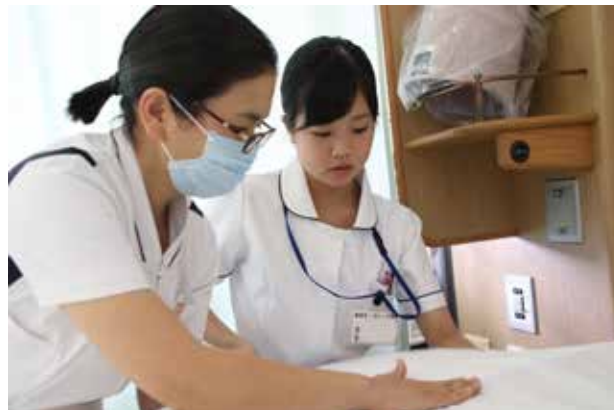
▲真剣な表情で看護師からの指導を受ける生徒