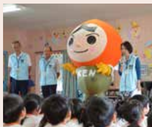
"人KENまもる君"と教室を開催

また、「人権身の上相談」(詳しくは20ページ)や、街頭啓発活動など人権の擁護・啓発をしています。