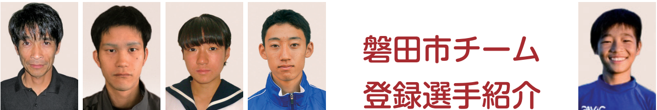
そめ ほつかさ 染葉司さん ヤマハ発動機株