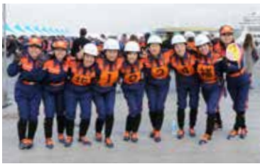
◀ 選手以外のメンバーも応援に駆け付けました