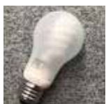
電球型蛍光灯 → 有害ごみ

電球と形は似ていますが、中に蛍光管が入っているものは電球型蛍光灯です。有害ごみの日に出してください。