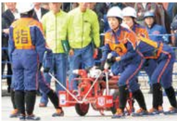
◀ 「操作始め」の掛け声で操法を開始