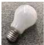
電球 → 埋立ごみ