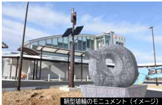
轆轤型植輪のモニュメント (イメージ)