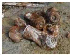
▲燃え残った食器類やスプレー缶など

修理には多くの時間や費用が掛かり、ごみの処理が滞ることによって大変なご迷惑をお掛けすることにもなりますので、ごみの適正な分別・排出にご協力ください。