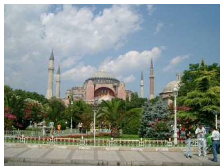
アヤ・ソフィア(イスタンブール) ギリシャ正教の教会を塔の増築などでイスラム教のモスクに改造しています。

今回は事前によく調べてから訪ねようと思っておりますが、家族も1人増えたため、出発はいつになることやら…。