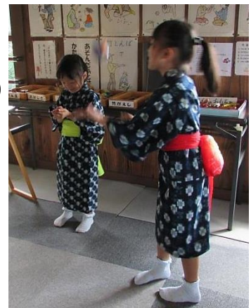
かすりの着物を着た児童