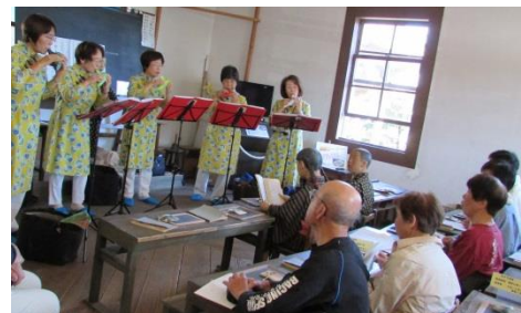
教室での楽器演奏の様子

見付地区はかつて東海道が通る宿場町であり、歴史や文化の息づく地域です。春におこなわれる「いわた大祭り」や秋におこなわれる「見付宿たのしい文化展」等、地域との連携により伝統文化や歴史的な背景を感じる場ともなっています。今年の「見付宿たのしい文化展」では、磐田に残るしっぺい伝説の紙芝居や、楽器の演奏などをおこないました。