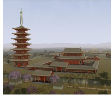
CGによる遠江国分寺の推定復元画