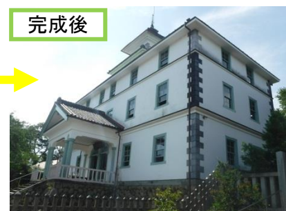
旧見付学校東壁の様子（左から2018年10月4日、2019年1月27日、2019年7月12日） 2/4 いわた文化財だより 第173号