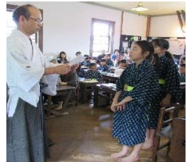
昔の授業体験（卒業証書授与）

また、石盤・石筆や昔の遊びを体験できるほか、教科書や教材、民具などの展示も充実しており大人から子どもまでがそれぞれの視点で学び、楽しめることが魅力です。