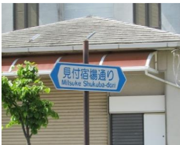
道路標識『見付宿場通り』

通りを歩いただけで3つの名前を見つけましたが、子供たちが答えたように、「見付本通り」が地元では定着しているのだろうと感じました。歴史ある道についてさらに興味を持つきっかけになりました。