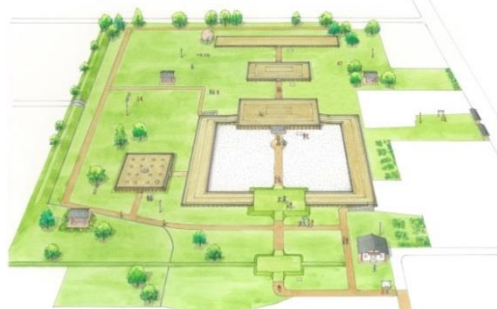
再整備後の遠江国分寺（イメージ図）

大正 12 年（1923）に史跡に指定された遠江国分寺跡は、昭和 42～45 年度に、国分寺跡の中で全国でさきがけとなる整備がおこなわれました。その整備から約 50 年、新しい時代のニーズに応えるため、再整備がおこなわれます。また、見付宿の東にある阿多古山一里塚（市指定史跡）は保全を主な目的として平成 30 年度に整備されました。