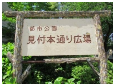
公園の看板『見付本通り』

そこで、旧見付学校の前の通りの名称を調べてみました。「旧東海道」の名称は、民家の壁面に2か所（立て看板）と「東海道・見付宿」の看板数か所に記載がありました。「見付本通り」の名称は、歩道に埋め込まれている案内表示と旧見付学校の南側の公園に大きな看板がありました。また、道路標識に目を向けると「見付宿場通り」と記載されている標識が数か所あるではありませんか。