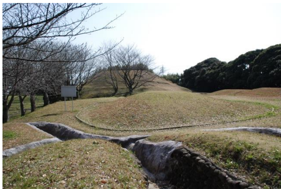
京見塚古墳の様子

遺跡や古墳は発掘調査によってはその価値を知ることになります。磐田市内で初めての発掘調査は、大正 11 年（1922）におこなわれた京見塚古墳（国府台）の発掘調査です。昭和 56 年に再調査がおこなわれ、史跡公園として整備されました。