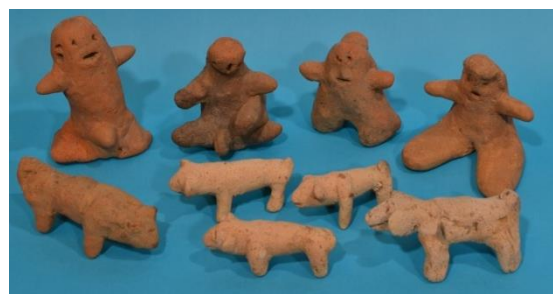
保存処理が終わった土製品

古墳・遺跡から見つかった遺物も磐田の歴史を考える上で重要です。明ヶ島古墳群から出土した土製品は国の重要文化財に指定されています。未来に伝えるため保存処理の作業を順次おこなっています。このたび、その一部が保存修理を終え里帰りをしたので展示をおこないます。