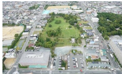
現在の遠江国分寺

遠江国分寺跡 史蹟名勝天然記念物保存法に基づき大正12年(1923)に国の史蹟に指定されました。戦後、文化財保護法に改正されると昭和27年に国の特別史蹟に改めて指定され、昭和45年に整備され、市民の憩いの場として永く親しまれてきましたが、設備の劣化などから、再整備が計画されています。