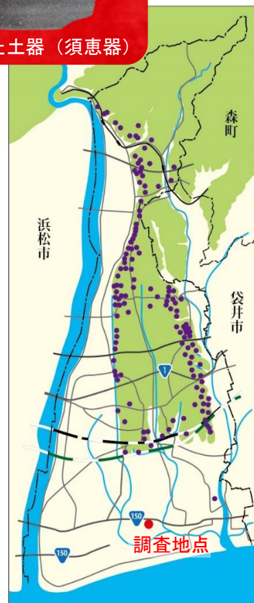
市内古墳分布状況