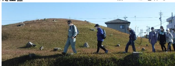
土器塚古墳の周囲をたんけん

遠江国分寺跡 かわらけづか や土器塚古墳などをたんけんしました。街中にも遺跡や古墳があること、その大きさを実際に現地で体感しながら学びました。