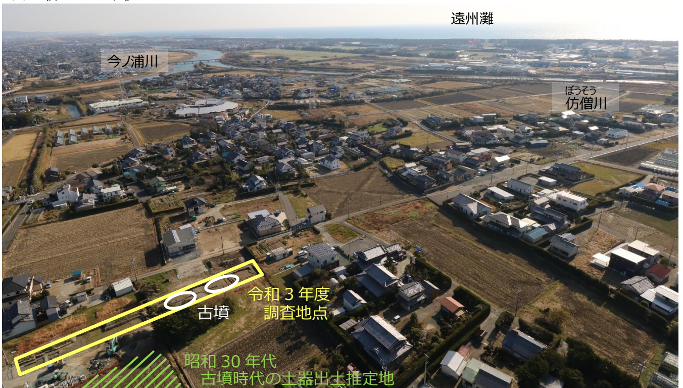
調査地点航空写真（上が南東）令和3年12月21日撮影

市道の予定範囲のうち830㎡を発掘調査の対象としました。標高1mの場所で直径約10mの円墳2基の周溝（古墳の周りに掘られた溝）が見つかったほか、溝7条、土坑5基なども見つかりました。検出された古墳はいずれも新発見で、海岸近くで古墳が見つかったのは市内で初めてです。