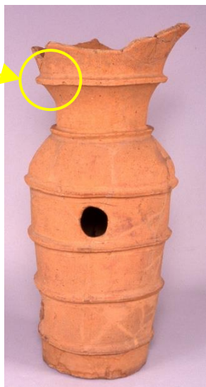
朝顔形埴輪 (堂山古墳 (東貝塚)出土) 高さ約 80 cm