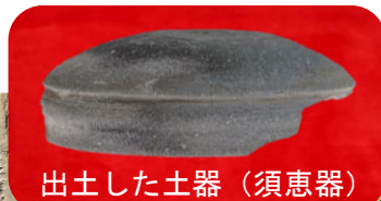
出土した土器(須恵器)