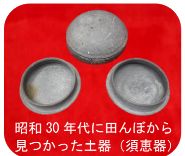
昭和30年代に田んぼから 見つかった土器（須恵器）

遠州灘の海岸平野に東西方向に延びる砂堤列上の、標高1.5m付近に立地します。昭和30年代に田んぼから古墳時代中期末（今から約1,550年前）の土器が出土したことで発見された遺跡です。これまでに4回の調査がおこなわれていますが、まとまった面積の調査は今回が初めてです。