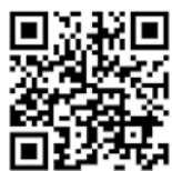
▲マイナンバーカード総合サイト