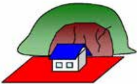
①危険住宅の取り壊し