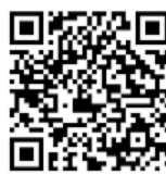
▲マイナポイント予約サイト