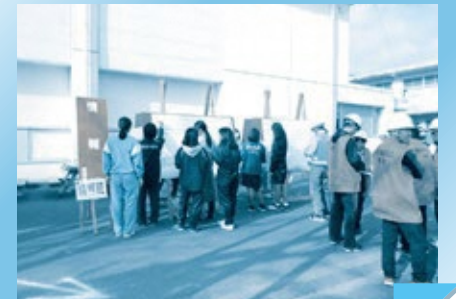
Seção de informações