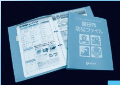
Pasta para Prevenção de Desastres