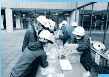
Preparação dos alimentos

※ A lista dos locais de Refúgio Determinados se encontra no Bōsai File ou na home page (em português) da cidade. ※ Receba informações sobre desastres, etc., se cadastrando no "Iwata Hot Line". (Faça a leitura do código QR e envie uma mensagem. Cadastre-se seguindo as instruções da mensagem resposta).