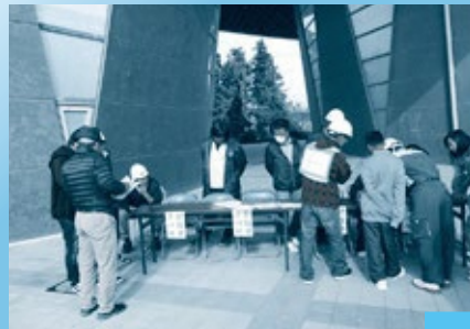
Recepção do local de refúgio