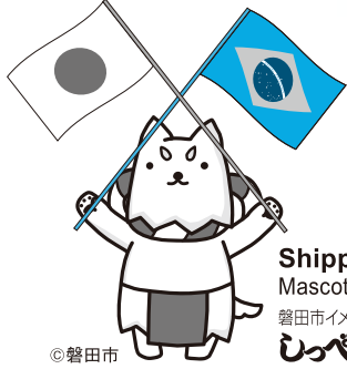
Shippei Mascote da cidade 磐田市イメージキャラクター しっぺい